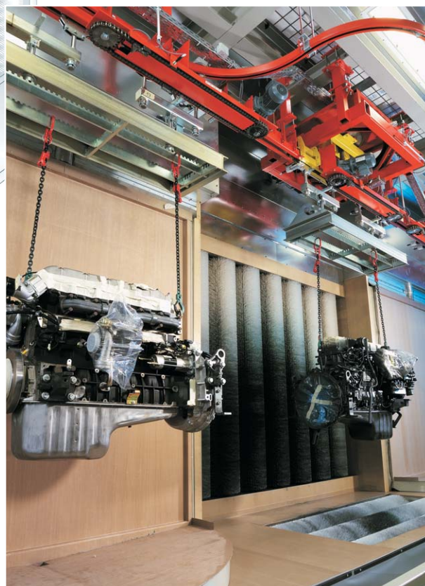
Beispiel einer Lackieranlage mit RTS-Rotation- und Coolac-Spritzwänden bei Deutz