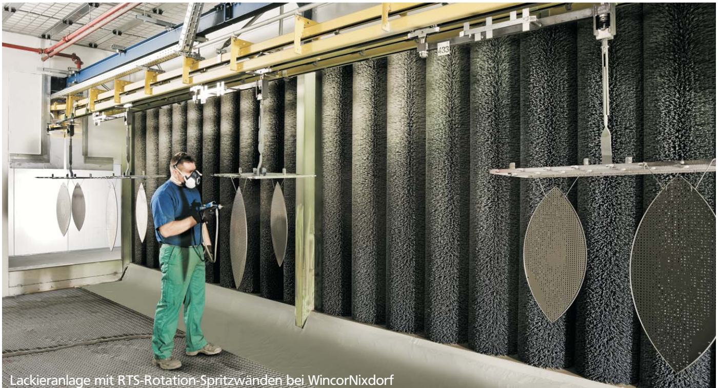
Lackieranlage mit RTS-Rotation-Spritzwänden bei WincorNixdorf